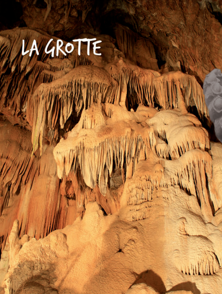
L'Aven Grotte Marzal Une merveille naturelle...